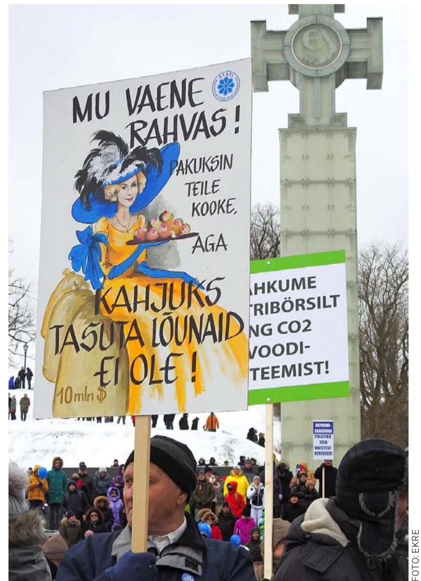
Ühiskond on jätkuvalt lõhestatud nii peaministri tegematajätmist, sundvaksineerimise tagajärgede kui sõjahüsteeria poolt.

Pärnu liberaalsed poliitikud hääletasid paraku linnakodanikele sõnaõiguse andmise vastu. Irooniline on see põhjendamata rahvavastatus just sellepärast, et liberaalsus tähendas algselt just vabadusi inimestele. Konservatiivid tulevad põhiõiguste taastamise algatusega ilmselt Pärnus uuesti.